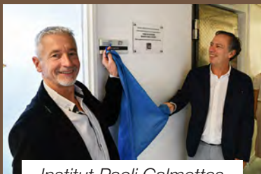
Institut Paoli Calmettes

Depuis dix ans, nous sommes le premier donateur privé de l'Institut Paoli Calmettes, le troisième centre anti cancer de France, en nombre de patients traités.